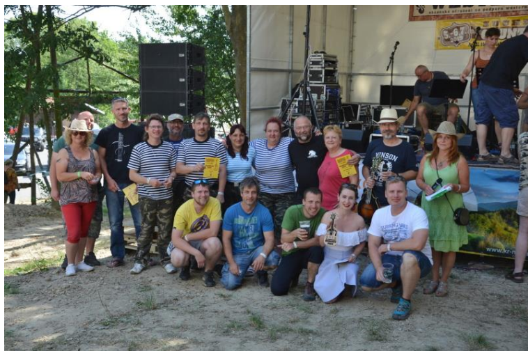
V sobotním poledním bloku zvítězila kapela Tak určitě! - acoustic music,