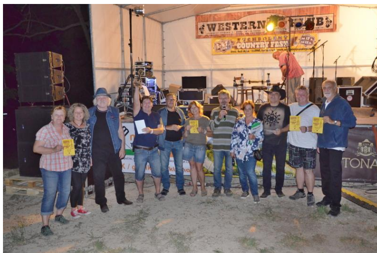
v odpoledním bloku obhájily loňské vítězství Bo!Bosorky